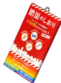
防災のしおり (壁掛けタイプ)